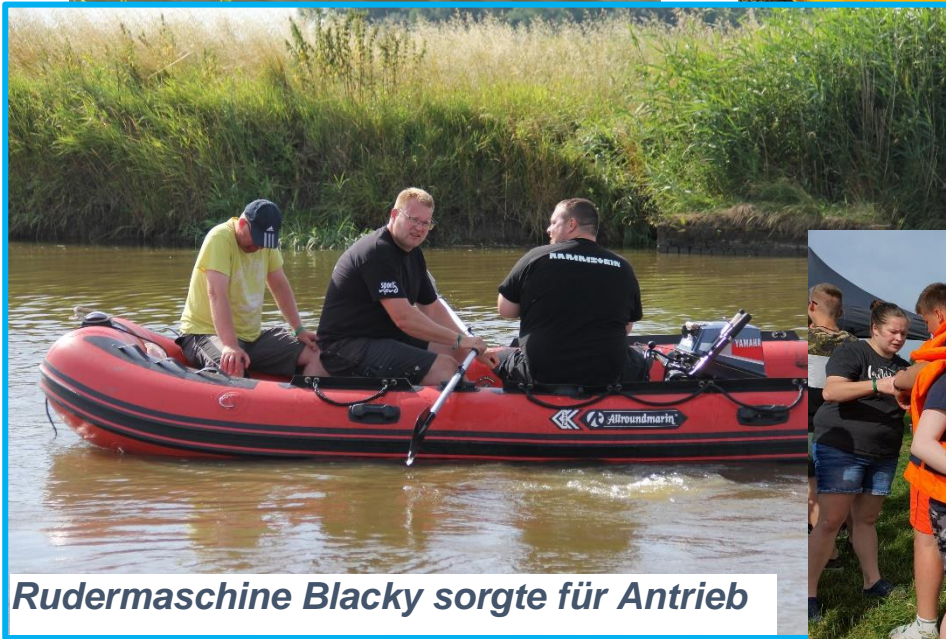
Rudermaschine Blacky sorgte für Antrieb